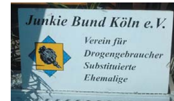
Vereinschild des „Junkie Bundes“

NEIN zum Drogentreff in der Taunusstraße!